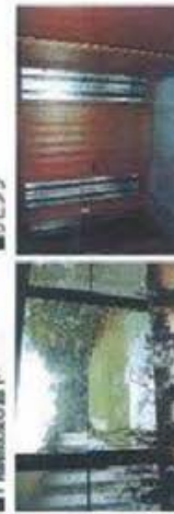
■リビングから庭を望む